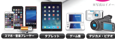
スマホ・音楽プレーヤー タブレット ゲーム機 デジカメ・ビデオ