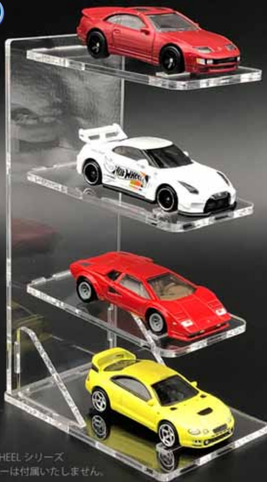
展示例：マテル HOTWHEEL シリーズ ※本製品に画像のミニカーは付属いたしません。